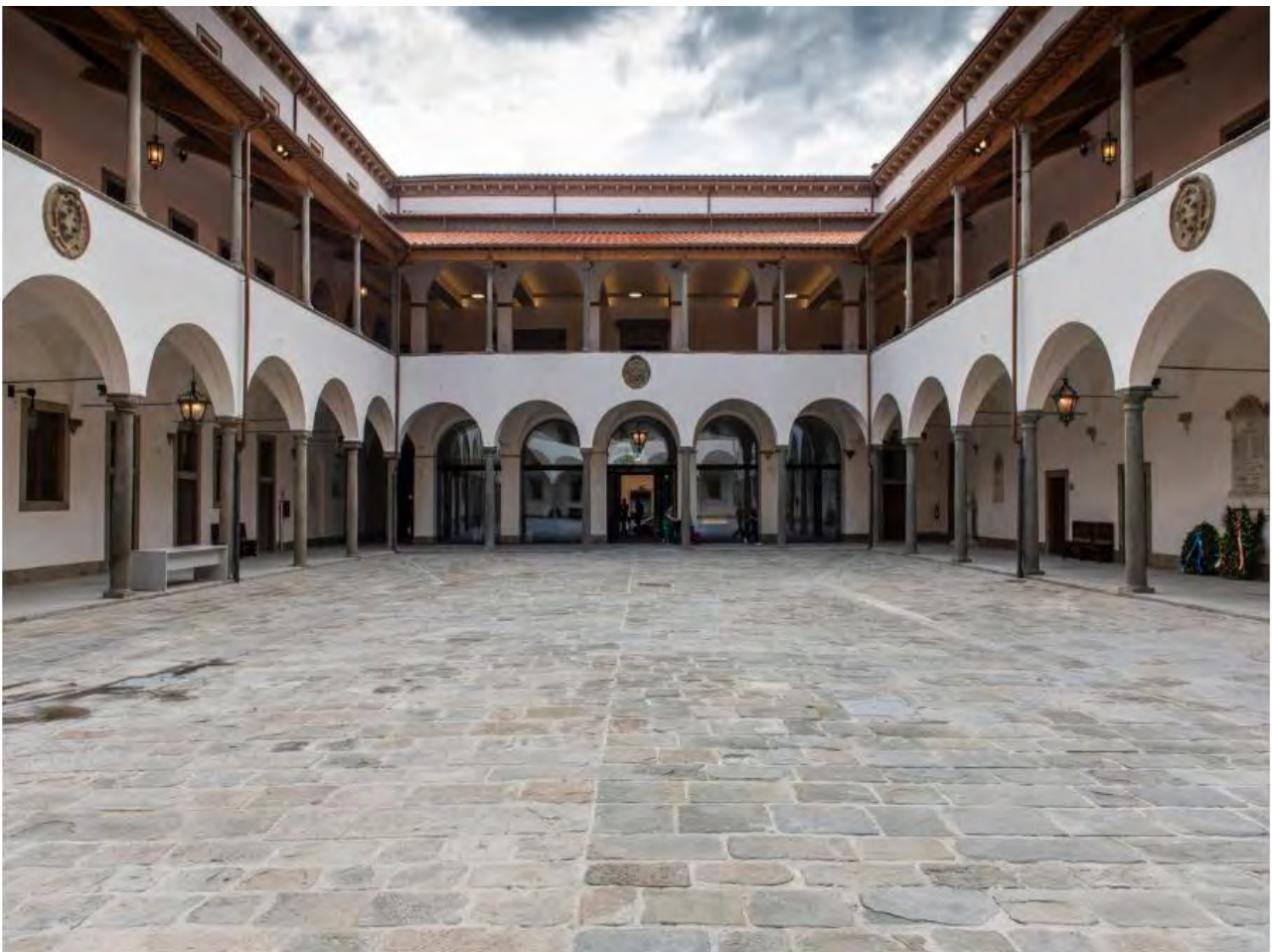
Il Palazzo della Sapienza di Pisa riaperto al pubblico dopo i lavori di ristrutturazione