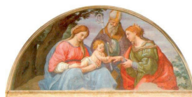
Ordine degli Avvocati di Perugia

grafica e stampa: Centro Stampa Giunta Regionale